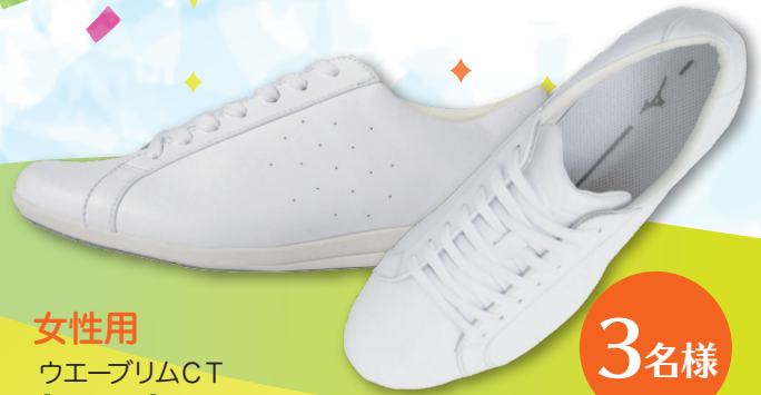
女性用 ウェーブリズムCT [ホワイト]