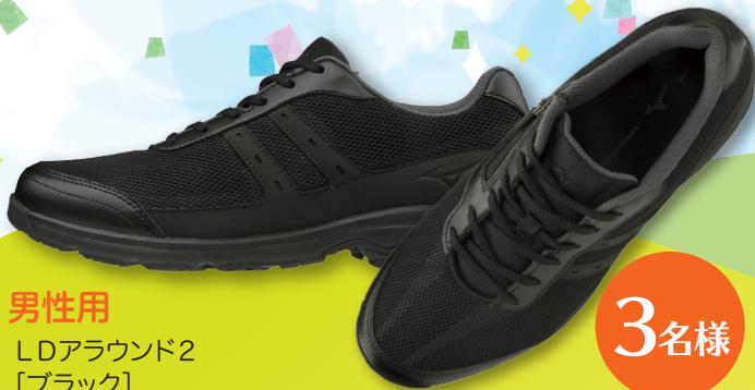
男性用 LDアラウンド2 [ブラック]