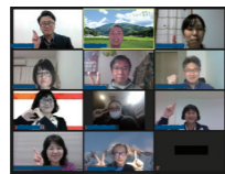
▲域外プロボノワーカーと