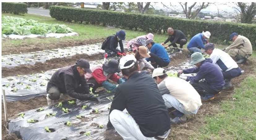
農作業実習の様子（露地野菜コース）

（注）納入方法等については、受講決定通知時に連絡します（ 納入後は原則返金しません ）。