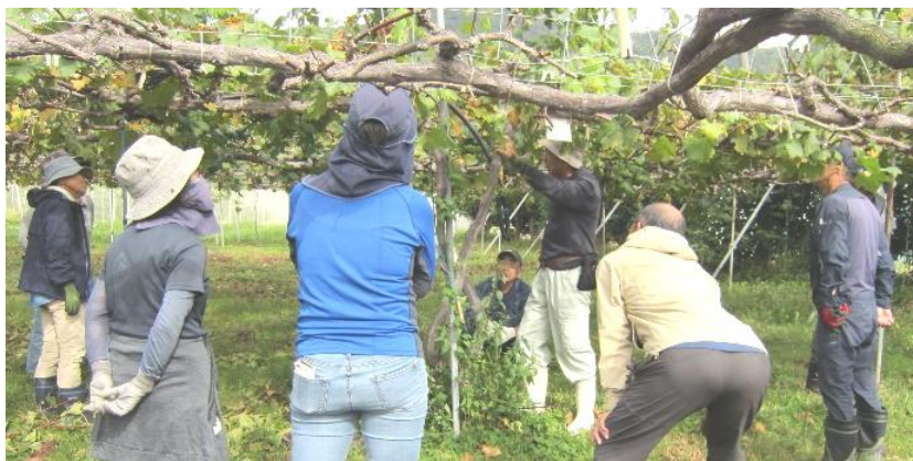
農作業実習の様子（果樹コース）