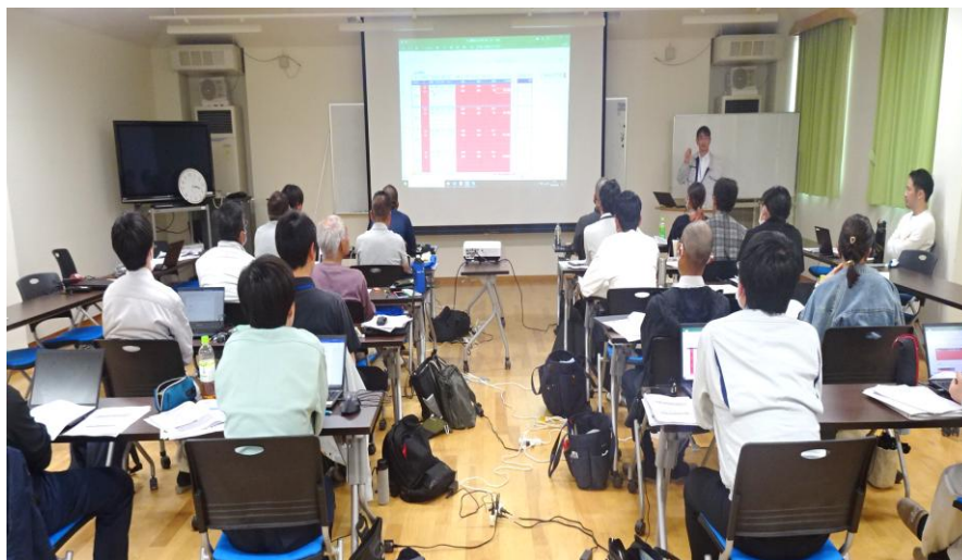
令和7年度第1回：営農計画の概要