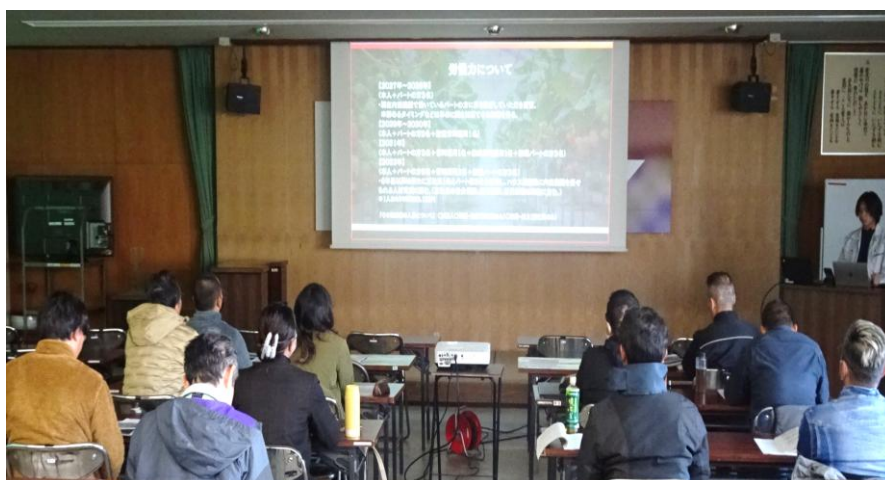
令和7年度第5回：営農計画発表会