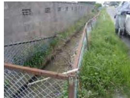
パトロールの様子

土地改良区では、通常の維持管理の際にも危険箇所の把握に努めているほか、市や地域住民からの情報提供により危険箇所を把握している。