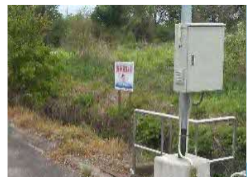
【事例】安全看板を設置

通学路、人口密集地区などで用水路への転落の危険性がある場合、可能な限り応急的な対策を実施する。