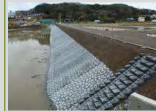
ため池護岸の整備