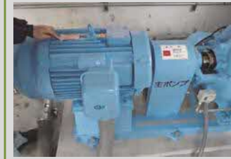
高効率型モータへの更新