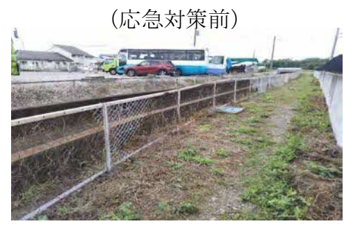
(応急対策前) 補助事業を活用したネットフェンス設置(イメージ)