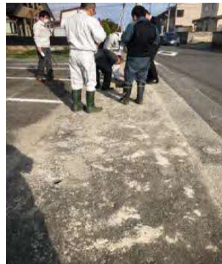
定期パトロールの様子