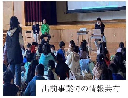
出前事業での情報共有

危険箇所を整理した安全マップにより、出前授業を活用し児童等を対象に安全啓発を実施する。また、新たな危険箇所等について意見交換を行い、安全マップの改善と危険箇所の共有に繋げている。