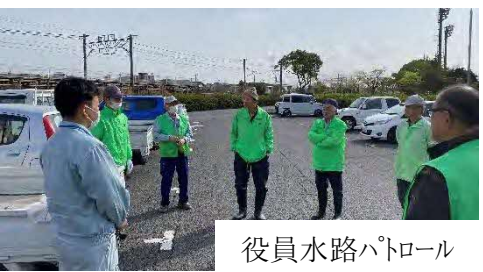
役員水路パトロール